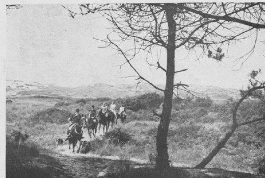
Dans les dunes.