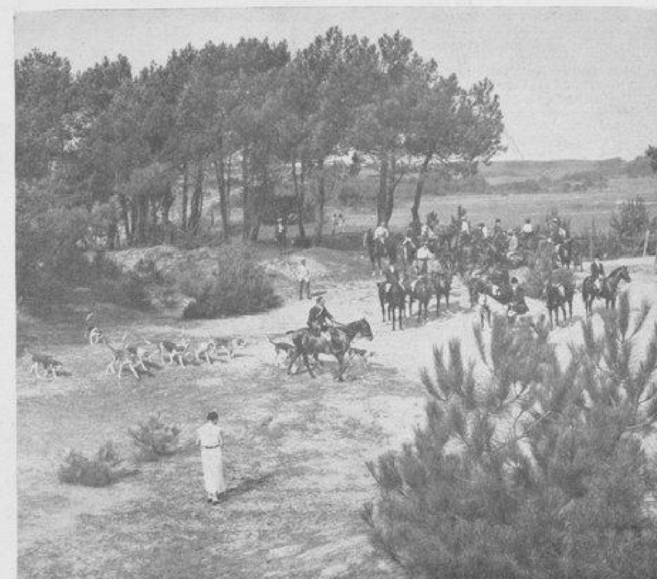
La meute arrive au rendez-vous en forêt.